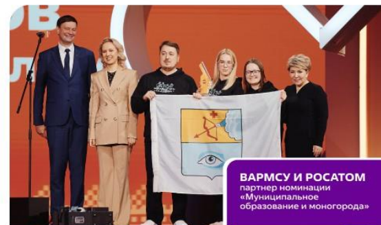
ВАРМСУ И РОСАТОМ партнер номинации «Муниципальное образование и моногорода»

• Публикация кейса вашей организации в Сборнике лучших практик Премии Тираж направляется в регионы