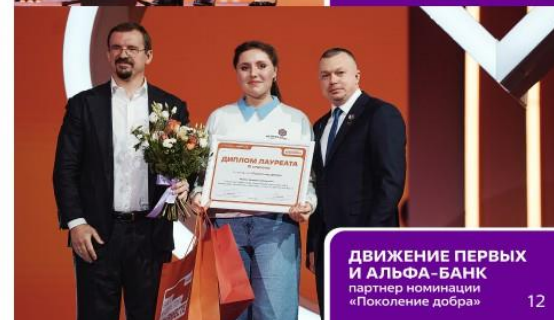
ДВИЖЕНИЕ ПЕРВЫХ И АЛЬФА-БАНК партнер номинации «Поколение добра»