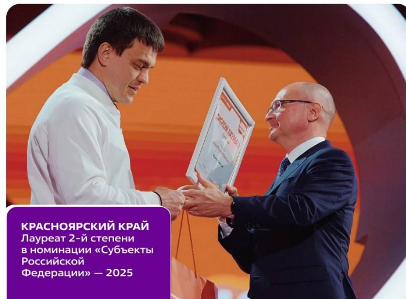
КРАСНОЯРСКИЙ КРАЙ Лауреат 2-й степени в номинации «Субъекты Российской Федерации» — 2025