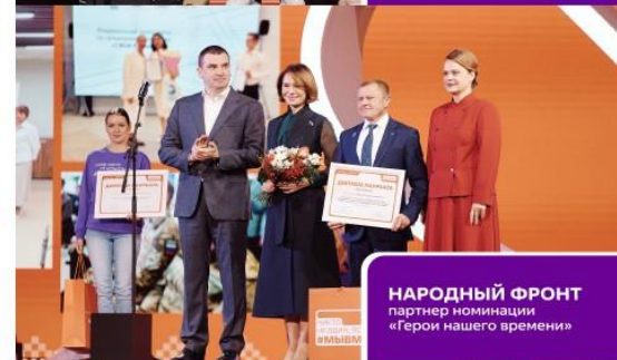
НАРОДНЫЙ ФРОНТ партнер номинации «Герои нашего времени»