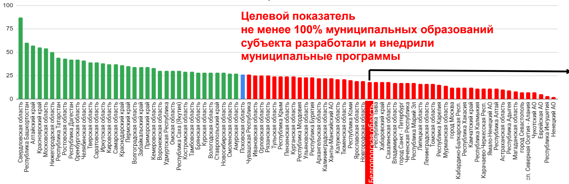
Количество сформированных муниципальных программ в ходе реализации федерального проекта «Укрепление общественного здоровья» по регионам